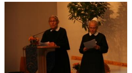
Segenswünsche der Schwestern