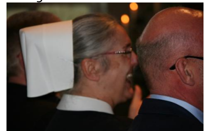
Freude ist angesagt!