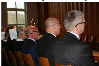
Würdenträger v. Stadt u. Kirche