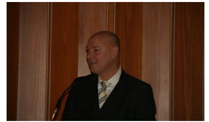
Grußworte vom Bürgermeister