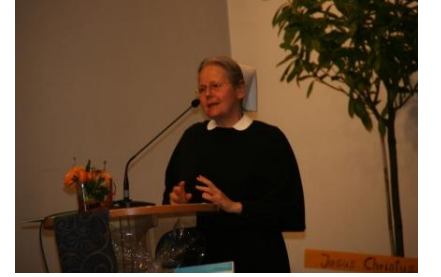
Grüße im Auftrag der DGD- Mutterhäuser