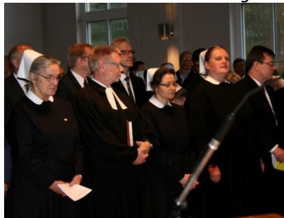
Verantwortung wird übertragen