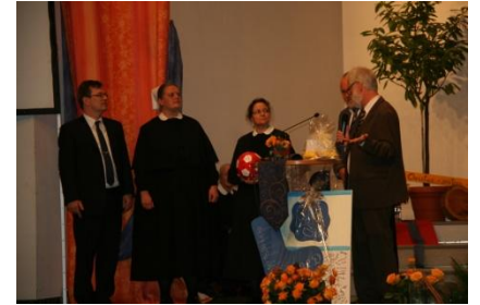
Das neue Team