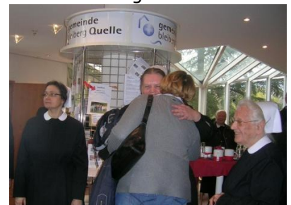
Segenswünsche nach dem Gottesdienst