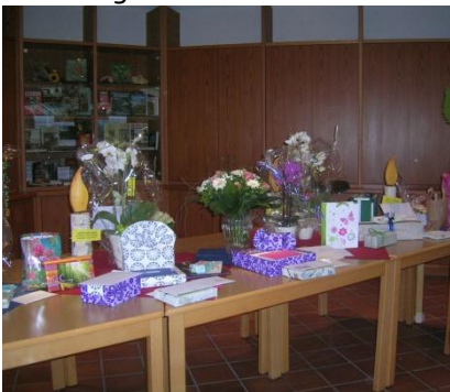
Herzlichen Dank dafür!