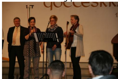
... musiziert und singt