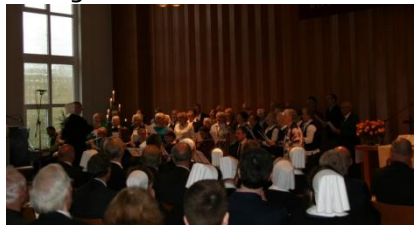
Der Gemischte Chor