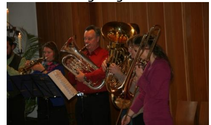
Fröhliche Klänge v. Pianobrass